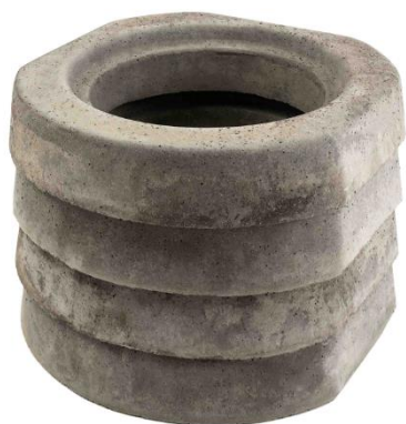
Speichersteine als Sonderzubehör